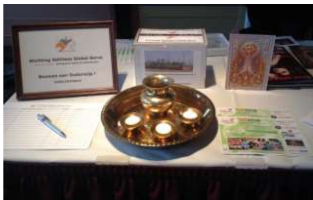
Onze tafel in Isala theater

In pauze van de concert hebben we 16 loten van de grote clubactie verkocht en de donatie box leverde ons € 13.60 op.